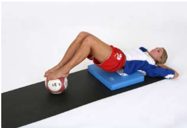
In Bauchlage: Gesäss anheben und Ball mit Füßen nach vorne rollen.