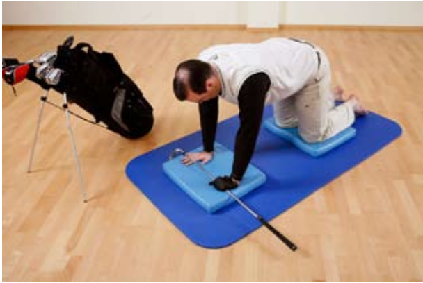
Ausgangsposition: Vierfüßlerstand, Hände und Knie auf jeweils 1 AIREX® Balance-pad Elite. Schläger in einer Hand.