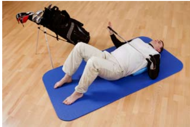
Ausgangsposition: Rückenlage, AIREX® Balance-pad Elite Kante auf Achselhöhe, Füße hüftbreit aufgestellt, Golfschläger in beiden Händen auf Brusthöhe abgelegt.