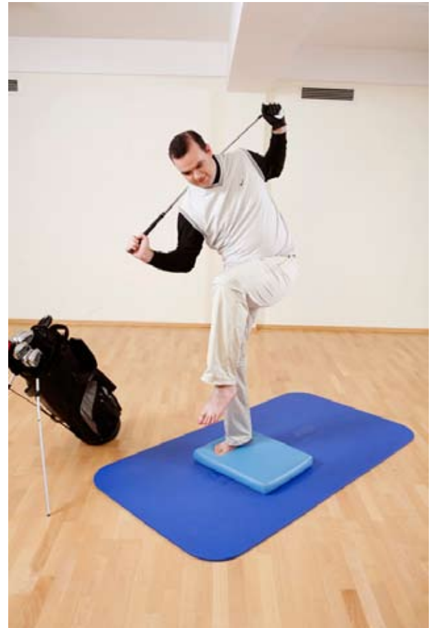
Übung: Oberkörper so nach vorne neigen und gleichzeitig gegenüberliegendes Bein anheben, so dass sich Knie und Ellenbogen berühren.