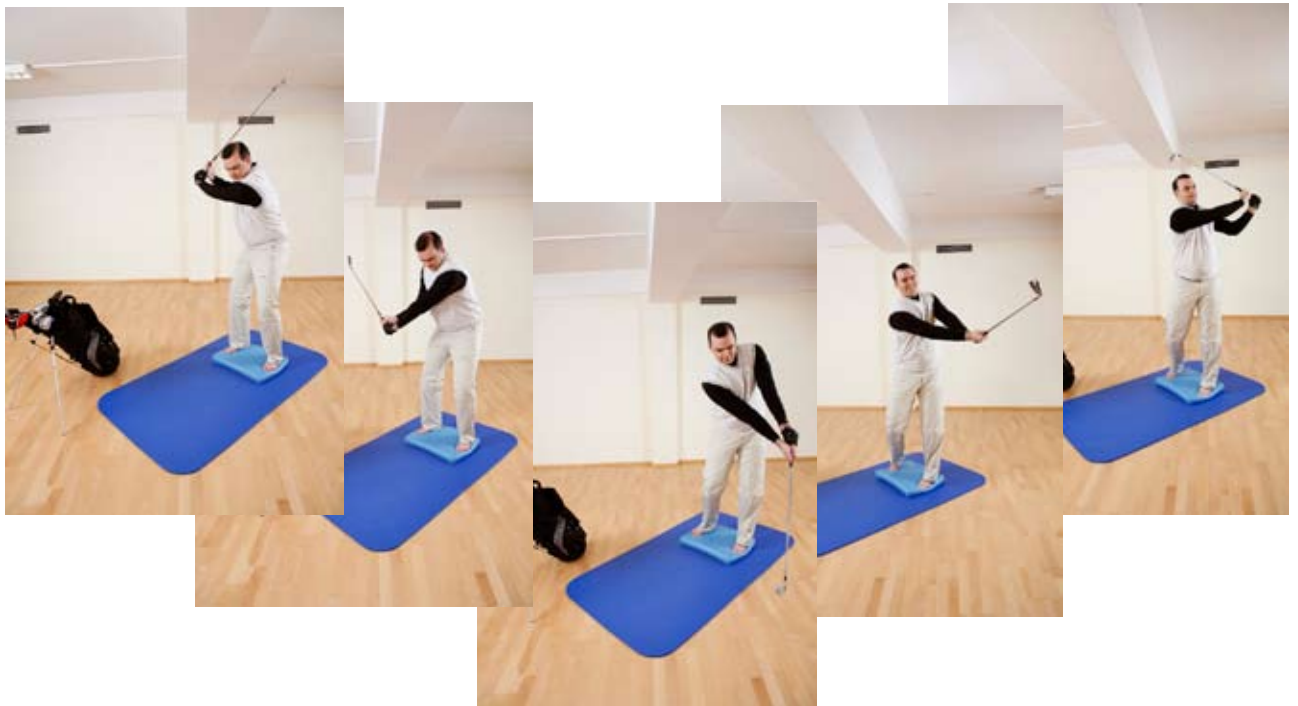
Übung: Golfschwung simulieren.