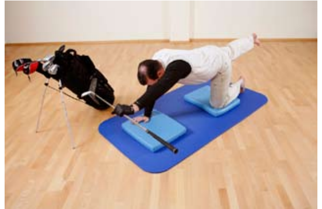
Übung 1: Schläger-Arm heben und gleichzeitig das entgegengesetzte Bein nach oben führen.