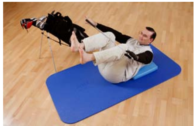
Übung 2: Beide Knie ran ziehen und gleichzeitig den Oberkörper heben.