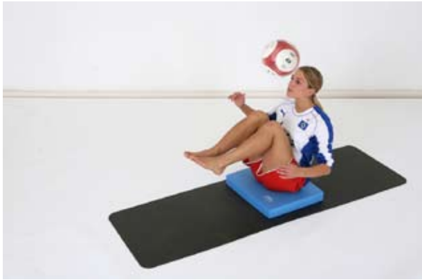
Aus Rückenlage: Ball in Klappmesser-Position köpfen, dann Beine und Oberkörper wieder ablegen.