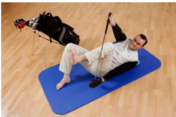
Übung 3: Ein Knie ran ziehen und den Oberkörper gleichzeitig diagonal zur Seite anheben.