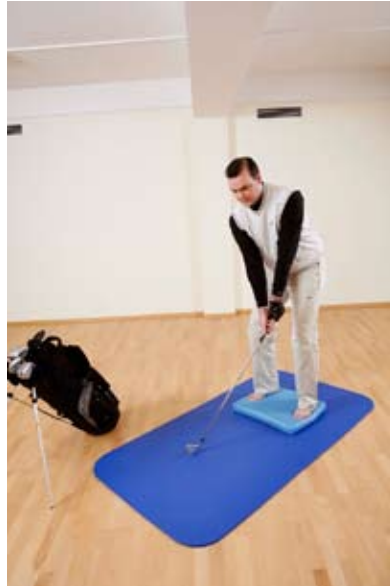
Ausgangsposition: Beide Füße auf AIREX® Balance-pad Elite, beide Hände halten senkrecht aufgestellten Golfschläger.