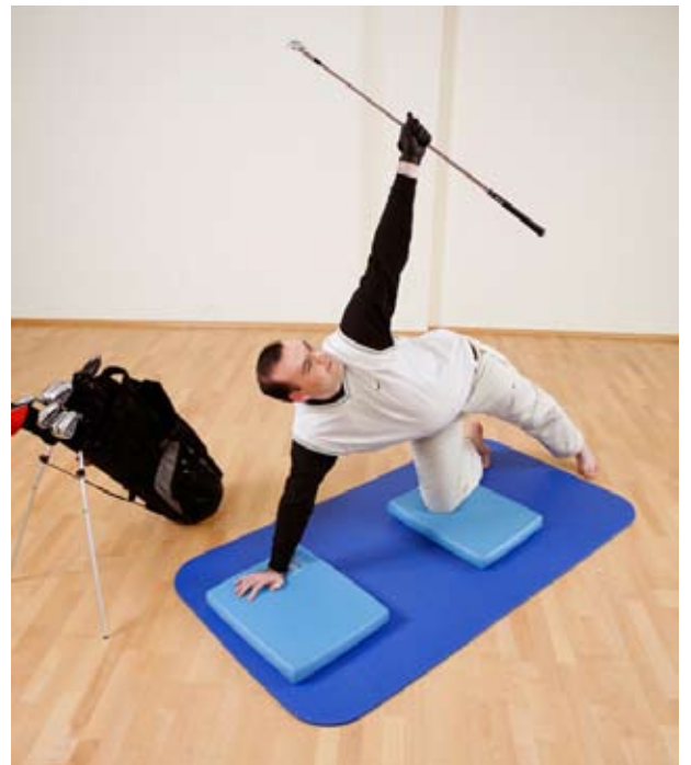
Übung 2: Den Oberkörper zur Seite öffnen/drehen und das Bein derselben Seite nach hinten stellen.