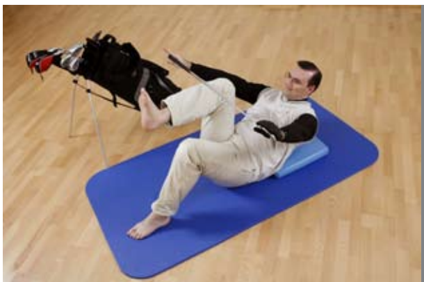
Übung 1: Knie ran ziehen und gleichzeitig den Oberkörper heben, der Golfschläger berührt den Oberschenkel des angehobenen Beines.