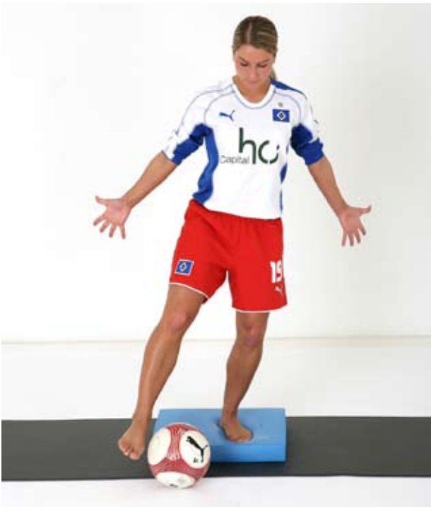
Ball vor dem AIREX® Balance-pad Elite mit Fuss hin- und her bewegen.