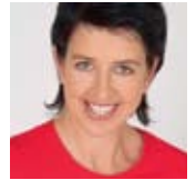
von Manuela Böhme